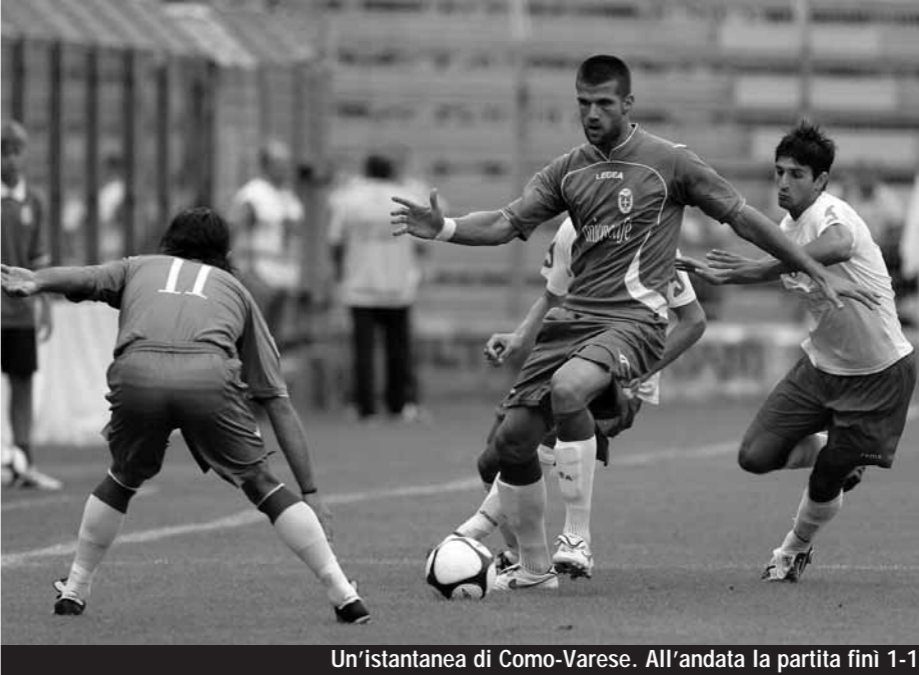
Un'istantanea di Como-Varese. All'andata la partita finì 1-1